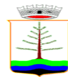
Comune di Baselga di Piné