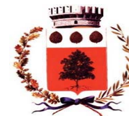
Comune di Bedollo